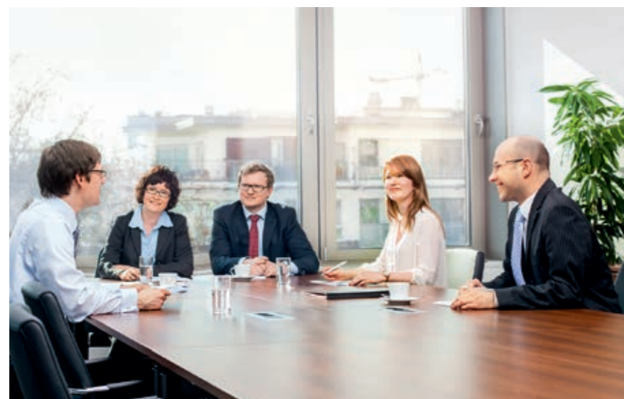
Der produktive Austausch ist bei der VBD ein Muss – sowohl intern als auch mit den Projektteams der Auftraggeber.

Eine unserer großen Kommunikationsstärken ist die Moderation bei Entscheidungsprozessen in Verwaltung und Politik. Wir binden die zuständigen Fachbereiche und Nutzer fest in die Projektgruppe mit ein und können so die unterschiedlichen Kompetenzen effizient bündeln. Wir bereiten Beschlussvorlagen vor, präsentieren diese und moderieren die Diskussionen transparent und überzeugend in politischen Gremien.