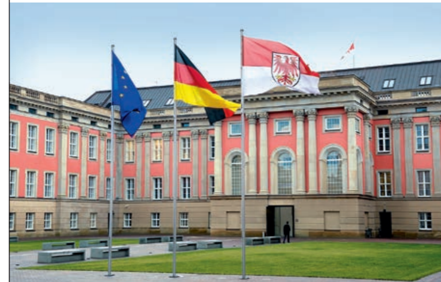
Landtag Brandenburg, Potsdam

Seit ihrer Gründung hat die VBD für über 360 Investitionsvorhaben Beratungsleistungen erbracht und dabei rund 240 Ausschreibungsverfahren begleitet.