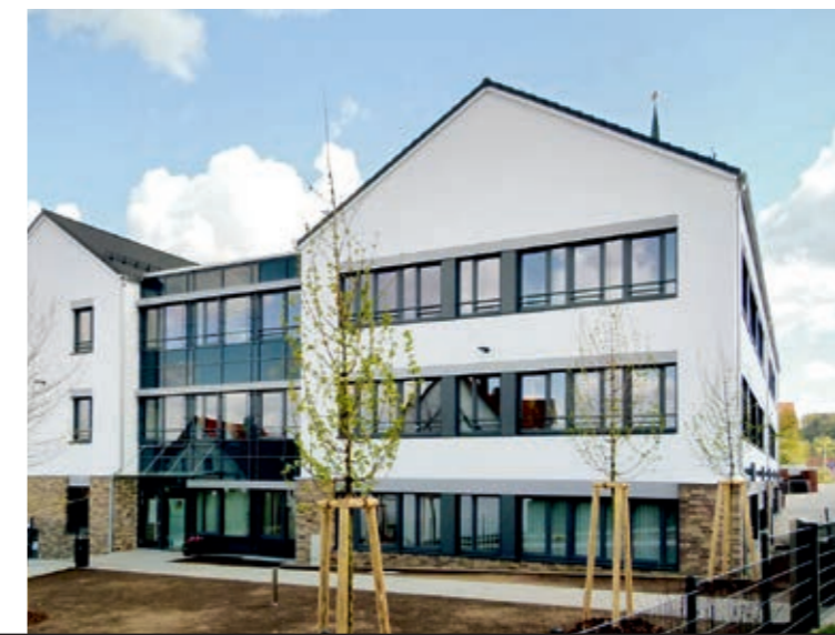
Landratsamt in Ansbach