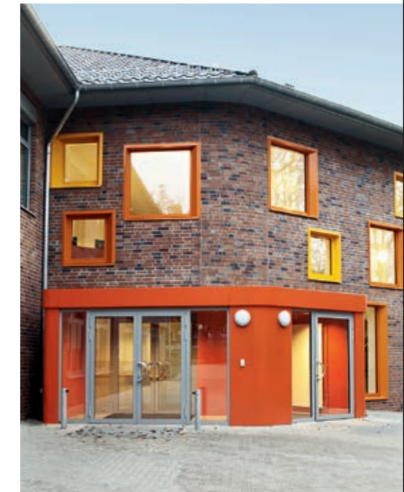
Gymnasium Athenaeum Stade