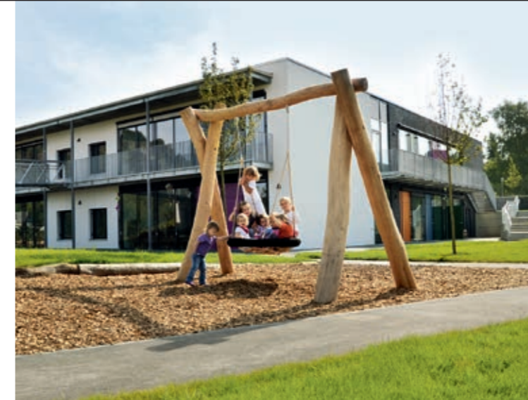
Kindertagesstätte in Gerolstein